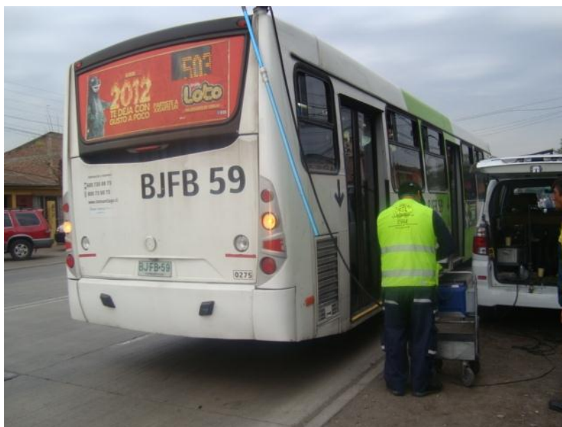
Figura N°1. Control de opacidad

El 3CV es el organismo encargado de controlar la opacidad a buses infraccionados en la vía pública, Figura N°1. Este control es aplicable para los buses de transporte de pasajeros que circulan por la Provincia de Santiago y las comunas de Puente Alto y San Bernardo, que hayan sido infraccionados en la vía pública por el Departamento de Fiscalización de la Subsecretaría de Transportes. Dado el incumplimiento de las normas de emisiones contaminantes, conforme lo señalado en la Resolución N°75/1996 y al D.S. N° 4/1994 ambos del Ministerio de Transportes y Telecomunicaciones, quedando además el vehículo inhabilitado para el transporte de pasajeros, ya que el documento que lo acredita para tal efecto es retirado al momento de cursar la infracción por personal del Departamento.